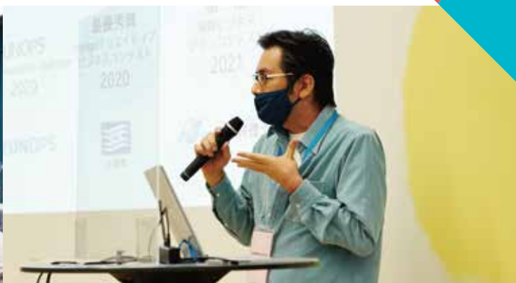
(起業プラザひょうごのイベント風景)

新規創業者や創業間もないスタートアップが、自社の優れた商品やサービスのビジネスプランを発表する「ひょうご神戸・ピッチイベント」を開催します！7社がピッチを行い、その後、会場にて発表企業との名刺交換、個別商談の時間もご用意しています。スタートアップとの協業や連携、新しい取引先の発掘・開拓、投資や融資など金融機関とのマッチングなどにご活用ください！大手中堅企業、金融機関、ベンチャーキャピタル・支援機関等をはじめ、多くの皆様のご参加をお待ちしております！（発表企業7社の詳細は裏面をご覧ください）